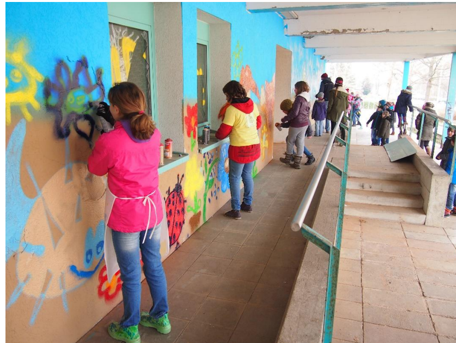
Projektteil „Zukunftsstadt Saalfeld“: Wiederbelebung eines örtlichen Schandflecks und Angstorts