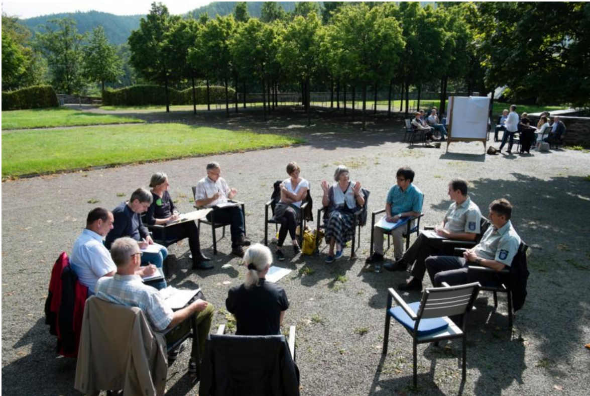
Schwarzburger Gespräche 2017 zum Thema "Leerstand im ländlichen Raum"

Ziel ist es, mittels mehrerer Gemeindestudien im LK Waldeck-Frankenberg und LK Saalfeld-Rudolstadt, nach sozialen Orten zu „suchen“, diese zu analysieren und kritisch zu betrachten, im Hinblick auf die Frage, inwiefern sie sozialen Zusammenhalt erzeugen.