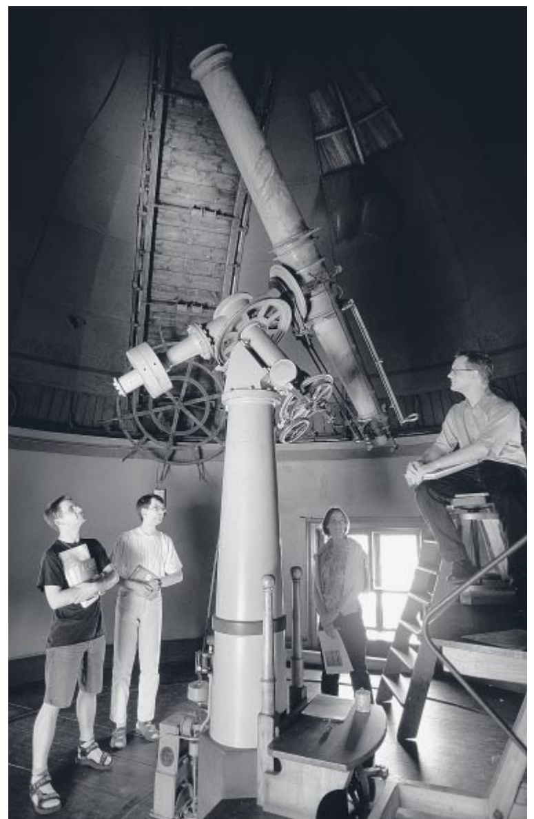
Lebendige Wissenschaftsgeschichte: Die Sternwarte übt bis heute eine ganz besondere Faszination aus – auf Forscher ebenso wie auf Studierende